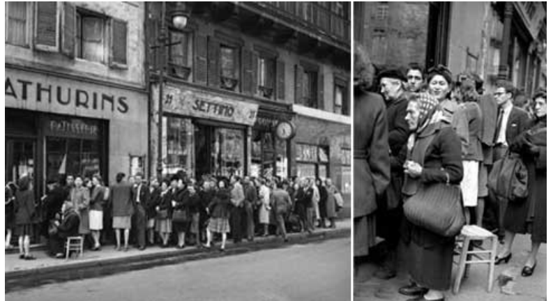
Queue devant une boulangerie en 1947 à Paris

La France ne connaît pas de réelle croissance et la vie est difficile en raison des bas salaires et du coût élevé de la vie.