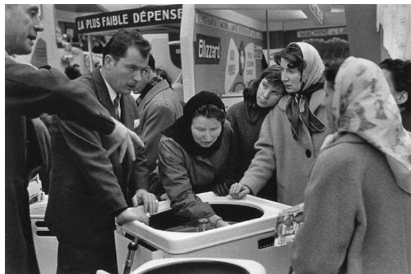
Salon des Arts Ménagers 1956 - H. Cartier Bresson

L'institution de la Sécurité sociale permet de se prémunir contre les aléas qui affectent la vie professionnelle. Parallèlement, la France connaît une situation de quasi-plein-emploi pendant laquelle le taux de chômage est contenu à un niveau compris entre 2% et 3% (contre environ 9,5% en 2005).